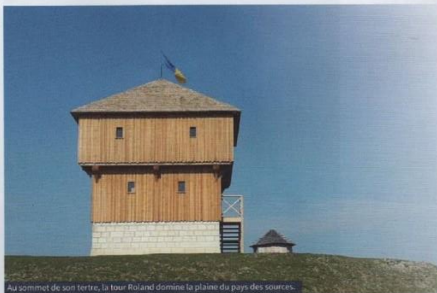
Au sommet de son tertre, la tour Roland domine la plaine du pays des sources.